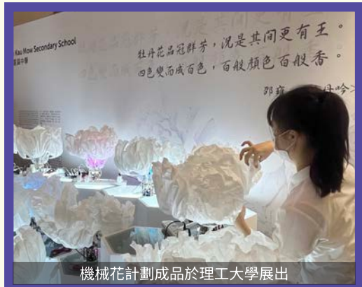
機械花計劃成品於理工大學展出

Our school has established partnerships with leading technology companies, research and tertiary institutions(eg. CUHK, HKU, PolyU, CityU, BU, UST and Youth College, etc) to offer students internship and research opportunities. Through interactions with professionals, students can tremendously broaden their knowledge and skills.