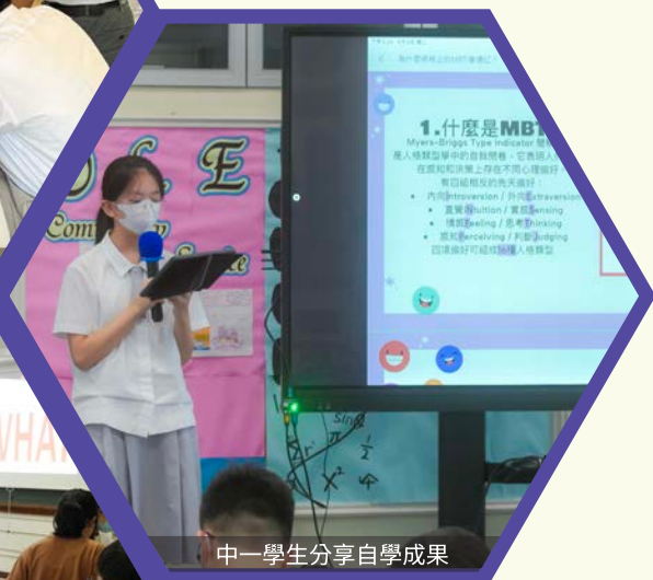
中一學生分享自學成果