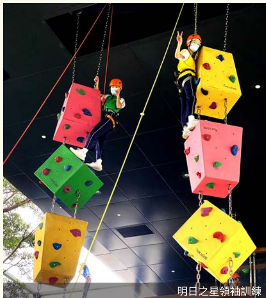
明日之星領袖訓練