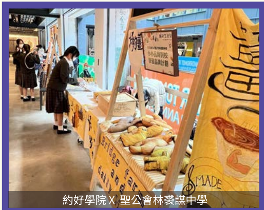
約好學院 X 聖公會林裘謀中學

本校積極推動創新科技教育，通過課堂活動及聯科活動，引導學生掌握不同的思考方法，培養他們的創意、協作和解難的能力。