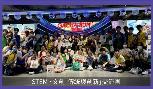
STEM·文創「傳統與創新」交流團

Additional resources are allocated to enhance the research skills of scientifically-gifted students.