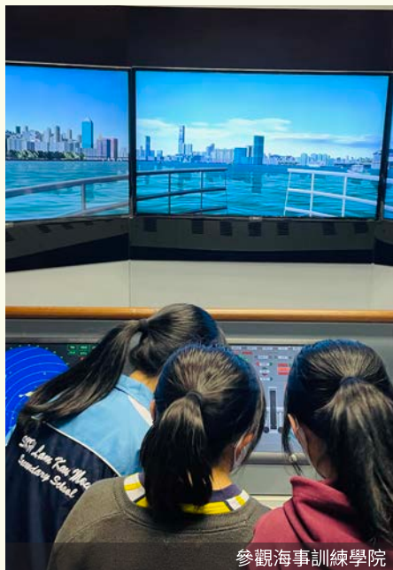
參觀海事訓練學院