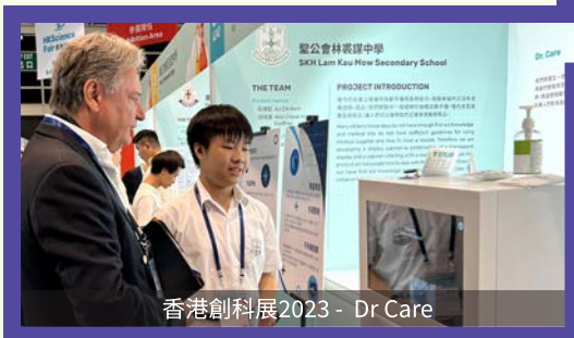
香港創科展2023 - Dr Care