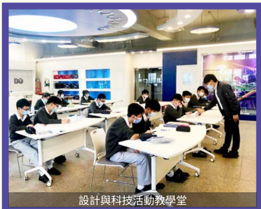
設計與科技活動教學堂

To develop in our students essential skills such as critical thinking, communication, and problem-solving, our school has been promoting STEAM education. We aim to teach students various modes of thinking, nurture their creativity, and cultivate their problem-solving and collaborative skills through systematic teaching and co-curricular activities.