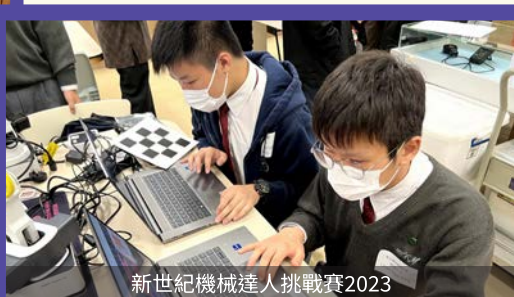
新世紀機械達人挑戰賽2023